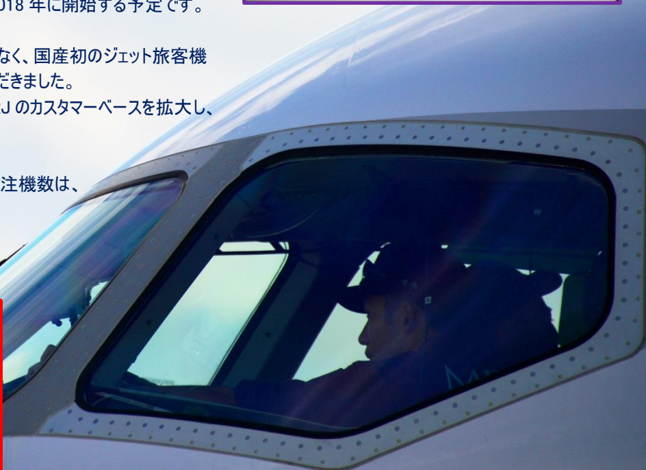
Flight Test Aircraft #1